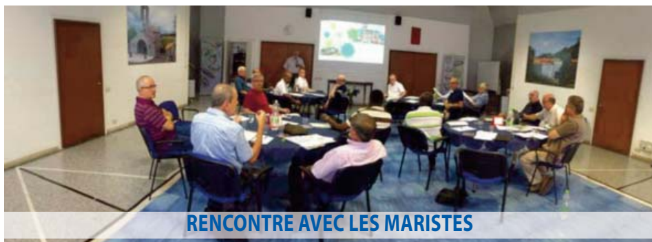
RENCONTRE AVEC LES MARISTES

Le Conseil général a commencé la semaine en ayant une session avec les Maristes. Nous avons discuté du projet Fratelli, nous avons partagé ce que nous avons appris sur la révision de la Règle, des nouveaux modèles d'animation, de gouvernement et de gestion, de la préparation du bicentenaire de la fondation de l'Institut des Maristes en 2017 et du tricentenaire de la mort de Saint Jean-Baptiste de La Salle en 2019.