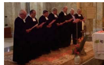
CELEBRACIÓN DEL 50.º ANIVERSARIO DE PRIMEROS VOTOS EN LA CASA GENERALICIA