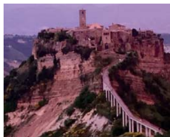
PANORAMA DESDE CASA EMMAUS