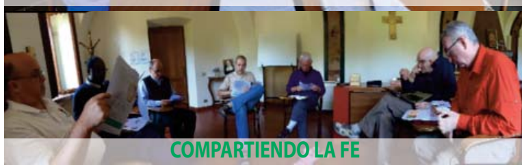
COMPARTIENDO LA FE