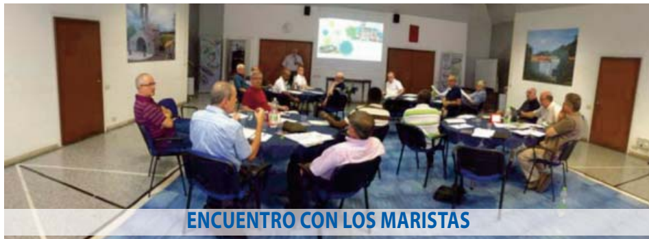
ENCUENTRO CON LOS MARISTAS

El Consejo General comenzó la semana teniendo una sesión con los Maristas. Dialogamos sobre el "Proyecto Fratelli", compartimos nuestros aprendizajes sobre la revisión de la Regla, los nuevos modelos de animación, gobierno y gestión, los preparativos para el bicentenario de la fundación del Instituto marista en 2017 y del tricentenario de la muerte de San Juan Bautista de La Salle en 2019.