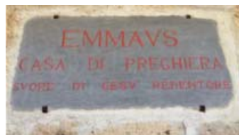
RETIRO DEL CONSEJO GENERAL EN CASA EMMAUS DE BAGNOREGIO