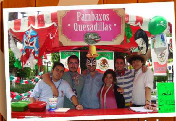
Participando en actividades de la Universidad