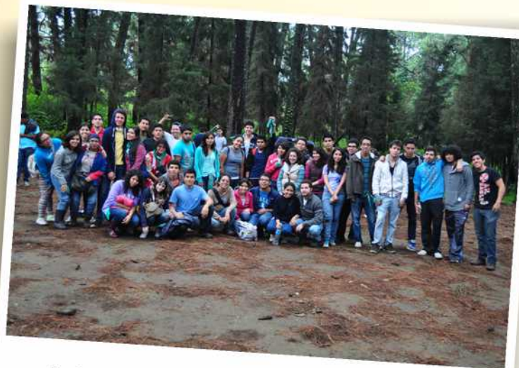
Integración de los representantes de los grupos estudiantiles

La Universidad La Salle México atiende a más de 10,000 Estudiantes.