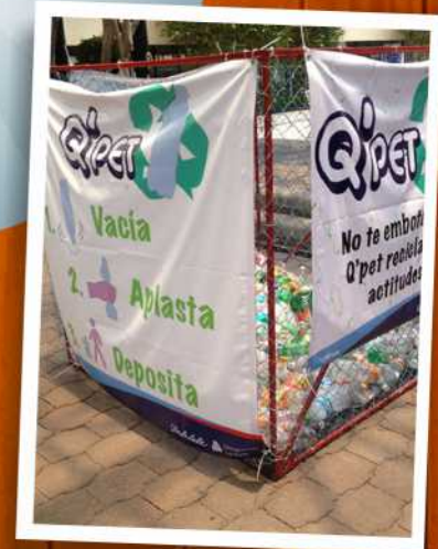
Campaña de reciclaje