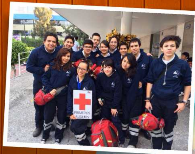
Grupo de Primeros Auxilios