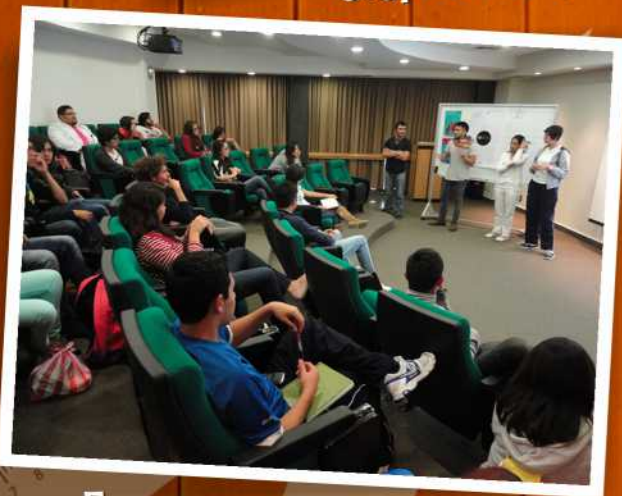
En curso de capacitación