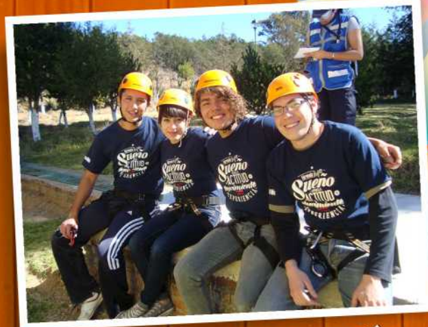
Actividades de integración